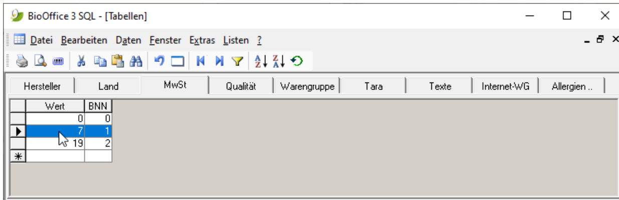
Tabellen -> Register "MwSt" - alte Werte

Klicken Sie dann in der Tabelle "MwSt" in das Feld mit dem zu ändernden Wert der Mehrwertsteuer in der Spalte "Wert" . Schreiben Sie den neuen Mehrwertsteuer-Satz in dieses Feld: