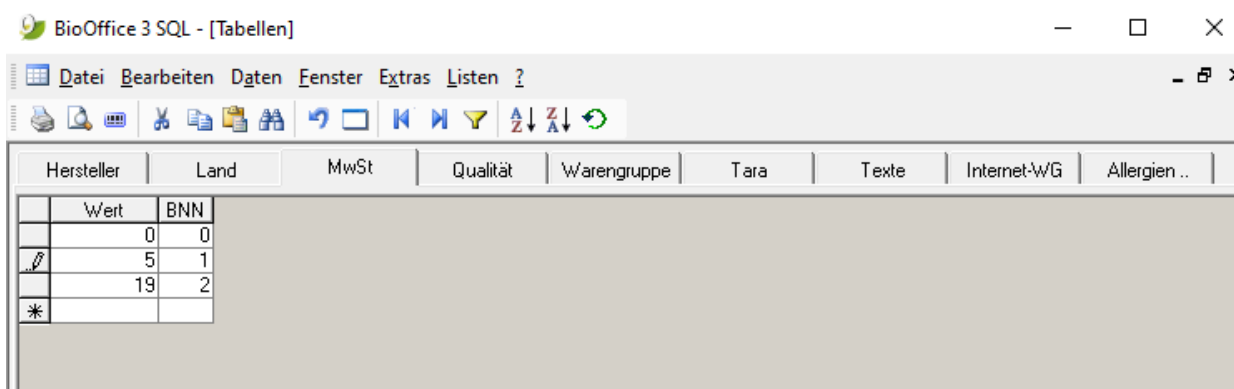
Tabellen -> Register "MwSt" - neuer Wert 5 %

Führen Sie diesen Vorgang wie beschrieben auch für den anderen Mehrwertsteuer-Wert in Ihrer Tabelle durch.